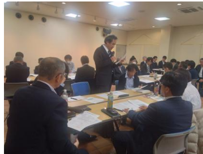
グループ討議結果の発表